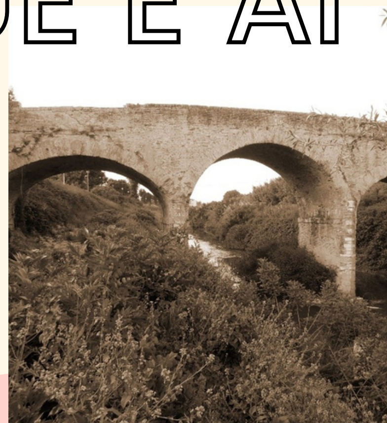
Il Ponte delle Portine